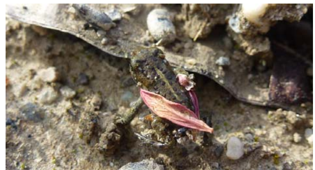
Un juvénile de crapaud calamite