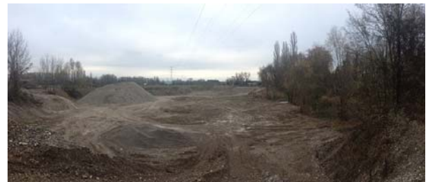
Le site avant démolition, Photo de Héloïse Candolfi