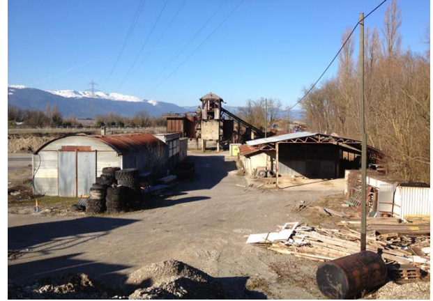
Le site avant démolition

Ce site - classé en réserve naturelle et inscrit à l'Ordonnance fédérale sur la protection des batraciens - a déjà accueilli le petit Crapaud calamite ( Epidalea calamita ), qui a profité des abondantes pluies de l'été pour faire son bonhomme de chemin jusqu'à la Petite Grave. En effet, le calme revenu sur les lieux a été fort profitable à l'espèce : elle a pu déposer des pontes en toute quiétude dans les zones humides du site, ce dernier constituant l'une des rares zones pionnières de la région. Véritable point relais entre la Champagne et les futures gravières de Bernex et Aire-la-Ville, la colonisation du site de la Petite Grave a constitué une excellente nouvelle pour la survie de l'espèce, actuellement très menacée.