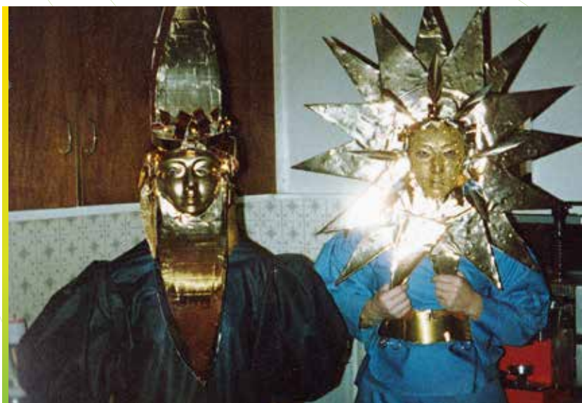
La lune et le soleil

Le premier bal de l'année avait lieu le lundi de Pâques, à Conignon. C'était une sortie inéluctable car elle faisait suite à la période hivernale et au Carême. Le village de Laconnex organisait le bal du lundi de Pentecôte et ensuite à Soral se tenait le bal des Roses. Ce dernier était également une manifestation incontournable. La vogue de Cartigny, associée à son bal traditionnel, annonçait le début de l'année scolaire. A la sortie de l'école à 16h, les élèves s'y précipitaient car ils recevaient un bon pour un tour gratuit en carrousel au grand dam des parents qui les attendaient pour recouvrir leurs nouveaux livres et cahiers. Pour clôturer l'année, le bal de l'Escalade était organisé à Cartigny. Il était très renommé et très fréquenté.